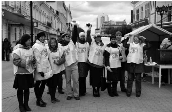
II областной День трезвости, пост трезвости на улицах города, 2009 г. (фото сверху); III областной День трезвости, пост трезвости, 2010 г. (внизу).