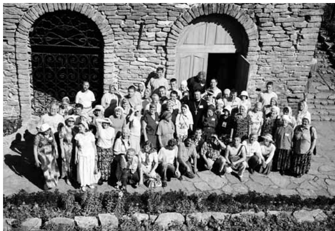
Паломничество участников VIII Всероссийской встречи православных трезвенников, 2006 г., г. Алапаевск.

Деятельность хоров окормляет духовник общества. Регента хора благословляет на должность духовник общества «Трезвение» и утверждает правление общества. Для решения организаци-