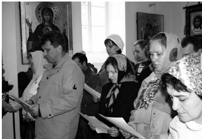
Молебен с принесением обета трезвости.

Обеты трезвости, таким образом, даются самими страждущими, их родственниками и людьми, занимающимися трезвенной работой, для укрепления себя в этом подвиге. После чинопоследования