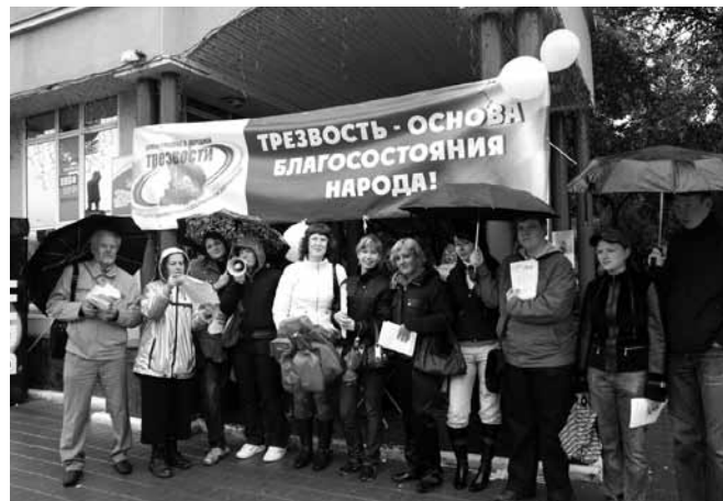
II областной День трезвости, круглый стол «Только б жила Россия». Участники — молодежь вузов Екатеринбурга. 2009 г. (фото вверху); I областной День трезвости. Екатеринбург, 2008 г. (внизу).