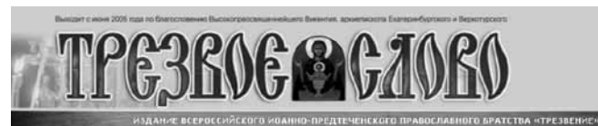
Фрагмент сайта журнала «Трезвое слово».