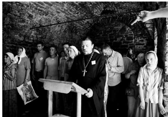
Молитва паломников общества «Трезвение» в склепе, где хранились мощи прпмц. Елисаветы и других алапаевских мучеников.

Краеведение и краеведческое движение являются действенным средством формирования трезвенных убеждений, воспитания чувства патриотизма и сопричастности к важному делу отрезвления Отечества. В то же время краеведение как всесторонняя научная и научно-популярная деятельность по изучению истории и ее особенно-