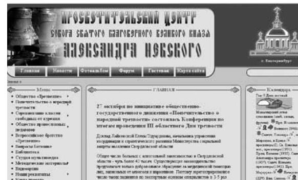
Сайт Просветительского центра собора Александра Невского Ново-Тихвинского монастыря.